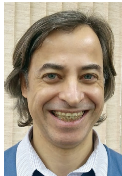
Matias: “Os valores de transporte e alimentação, desde que dados na forma e rigor da lei, também poderão ser excluídos da base de cálculo”