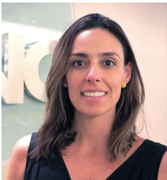
Ferreira: “O consumidor passou a procurar bens em detrimento de serviços”