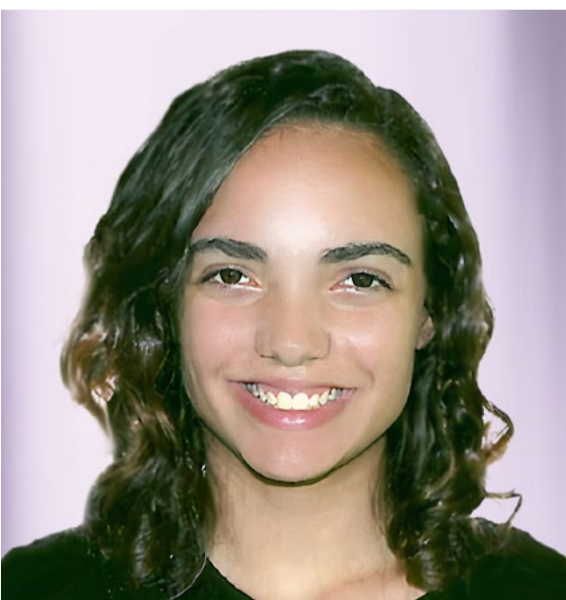
Gatti: “O grande desafio das empresas [...] é o controle e o planejamento”