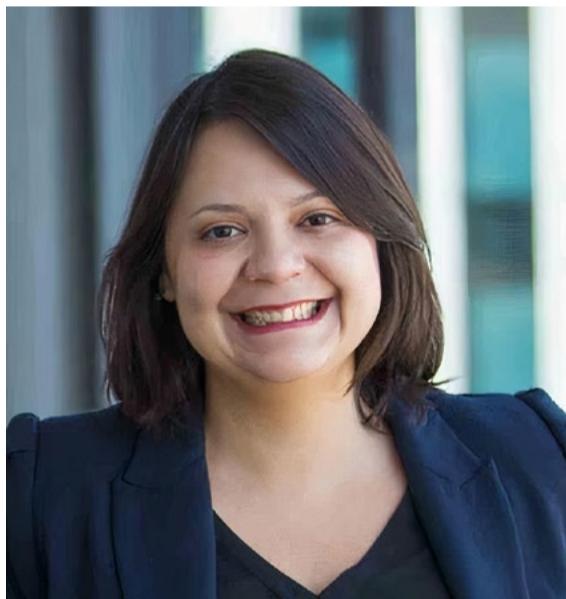
Oliveira: “[O OKR] é mais flexível, permitindo mudanças de rota com maior facilidade”