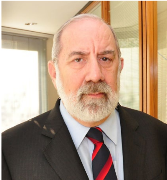
Couri: “A quebra da cadeia produtiva se deve à falta de crédito na ponta”

depende do estímulo ao crédito. Para as empresas, a recomendação é investir em inovação; aprimorar a negociação com fornecedores (buscando novos parceiros, fazendo negociações em grupo e revendo prazos de pagamentos e recebimentos); e melhorar o gerenciamento do negócio para conhecer bem o ciclo financeiro da empresa e as demandas dos clientes.