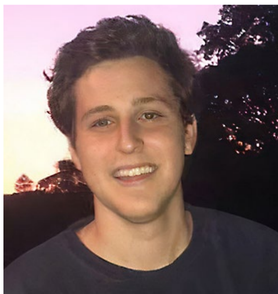
Sampaio: “É importante ter objetivos e resultados-chave para cada iniciativa”